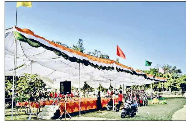
जीद। गणतंत्र दिवस समारोह को लेकर तैयार किया गया पंडाल।