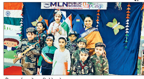
जीद। कार्यक्रम में प्रस्तुति देते बच्चे।